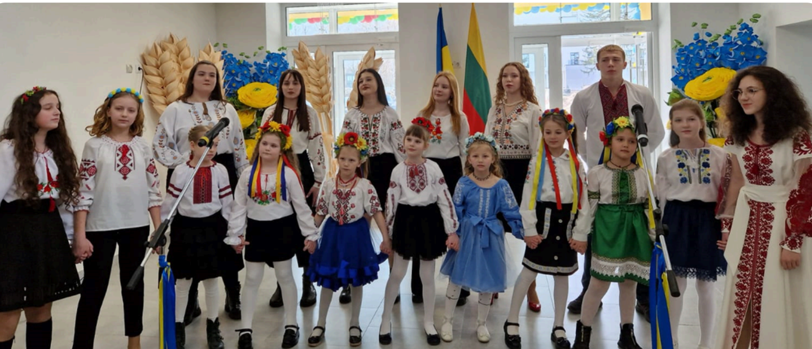
Borodiankos mokyklos atidarymas 2024 m. kovo 15 d.

Vienas reikšmingiausių pasiekimų – 2024 m. atstatyta karinių antpuolių sugriauta ir nuniokota Borodiankos mokykla Nr. 1 (Kyjivo sritis). Mokyklai atstatyti buvo skirta 8 mln. eurų. Dalį šios sumos – 1,8 mln. eurų skyrė Taivaniečių atstovybė Lietuvoje. Iš griuvėsių prikeltas Lietuvių ir ukrainiečių 1-asis licėjus nuo šiol šviesus, jaukus ir modernus.