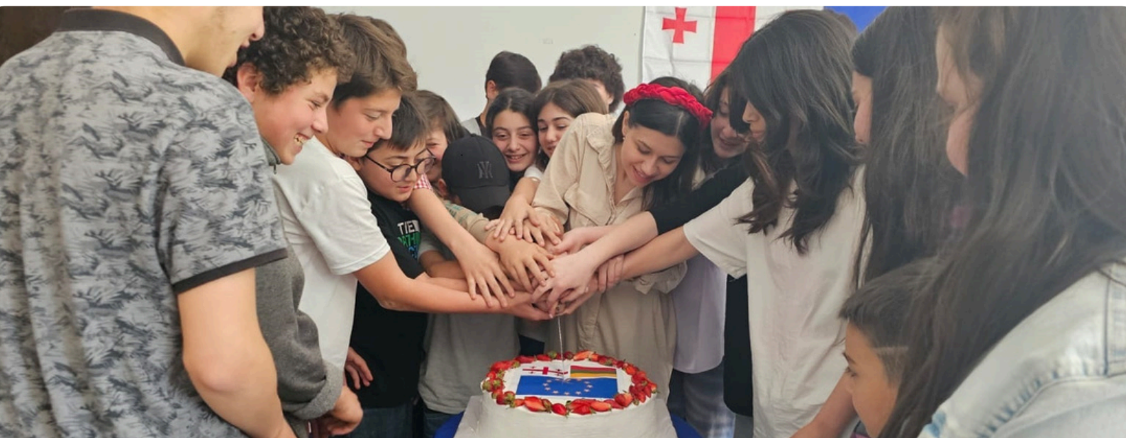
Europos dienų renginys, Sakartvelas.

2024 m. VBPD programos lėšomis įgyvendinti 4 dvišaliai projektai. Didinant visuomenės informuotumą apie europietiškas vertybes Lančchučio regiono moksleiviams ir jaunimui buvo organizuotas Europos dienų renginys, išleistas leidinys apie Europos Sąjungos teikiamas išsilavinimo ir užimtumo programas.