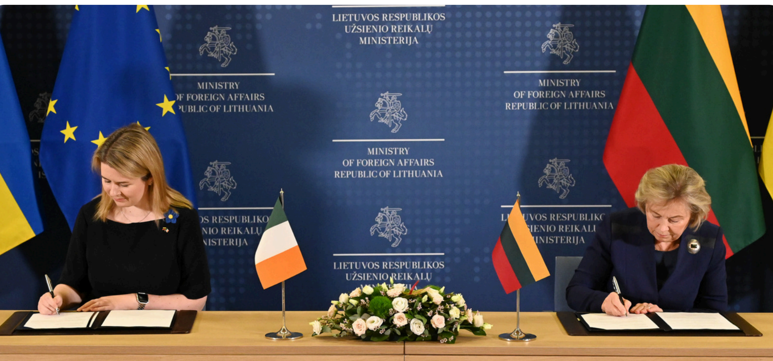
Lietuvos ir Airijos užsienio reikalų ministerijų Supratimo memorandumo pasirašymas, Vilnius