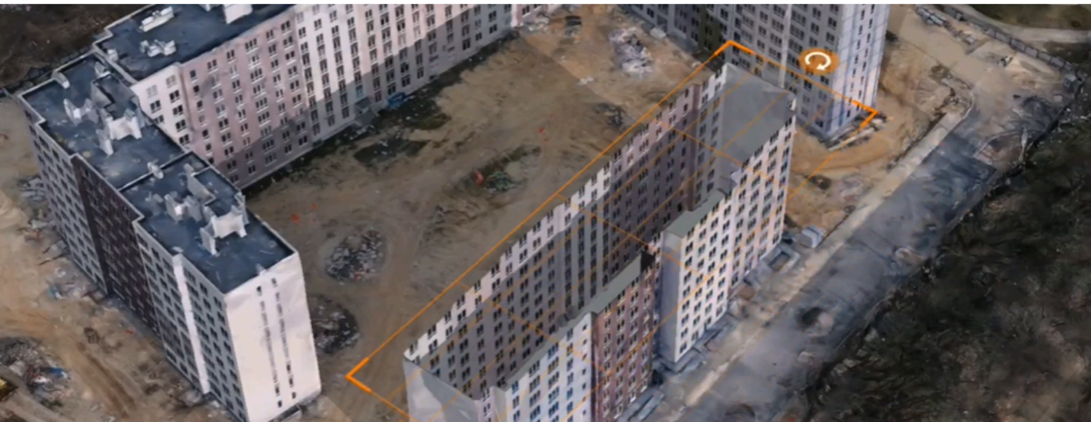
3D vizualizacijų interaktyvi Bučos ir Borodiankos atstatymo platforma

Antrasis tęsimas projektas – „Ateities mokykla Ukrainoje“, jo tikslas – sukurti adaptyvų techninį mokyklos projektą, kuris padėtų efektyviau, greičiau ir kokybiškiau atkurti sugriautą Ukrainos švietimo infrastruktūrą. Parengtu techniniu projektu galės nemokamai naudotis Ukrainos institucijos ir tarptautiniai partneriai, dalyvaujantys atstatant šią šalį.