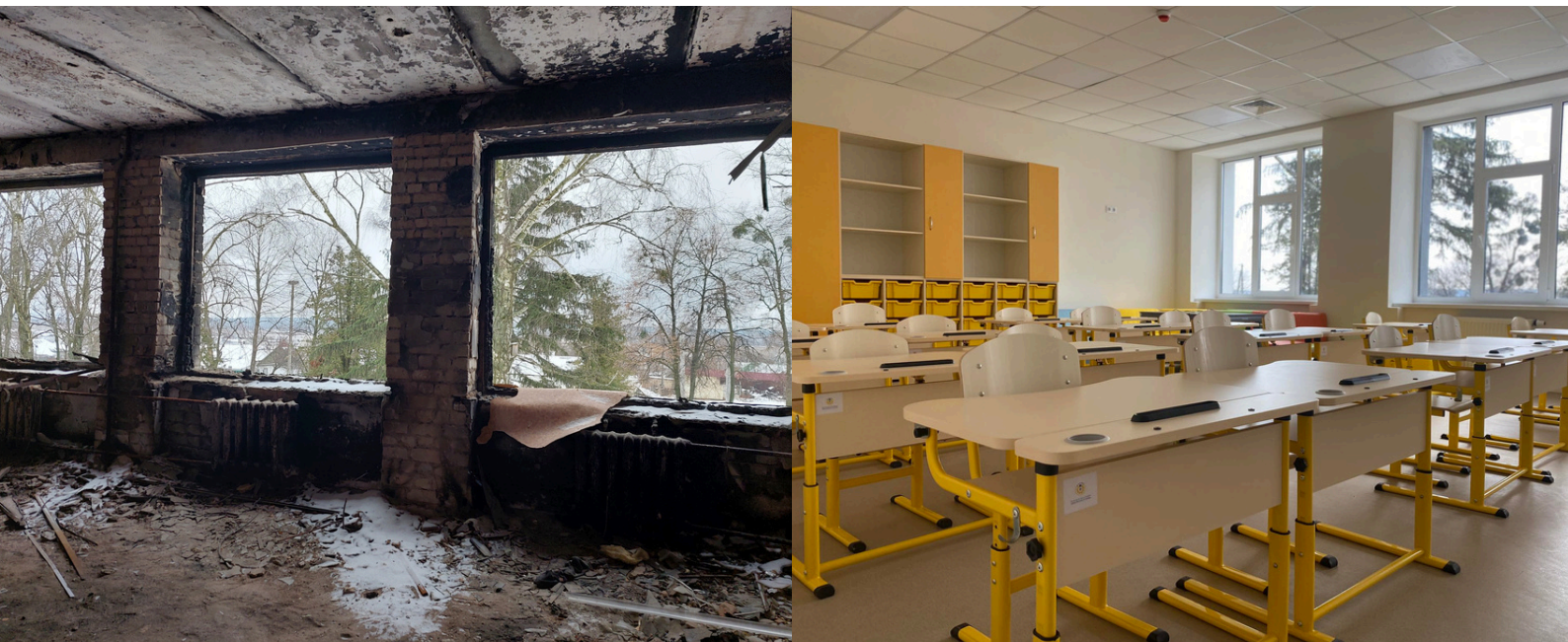
Borodiankos mokykla prieš ir po atstatymo.

„Mokykla buvo sugriauta, mes neturėjome kur mokytis. Nuotoliniu būdu mokytis buvo sunku, trūko priemonių. Sugrįžus į mokyklą mokslai ėmė sektis geriau, sulaukiau mokytojų palaikymo. Tai didžiulis skirtumas.