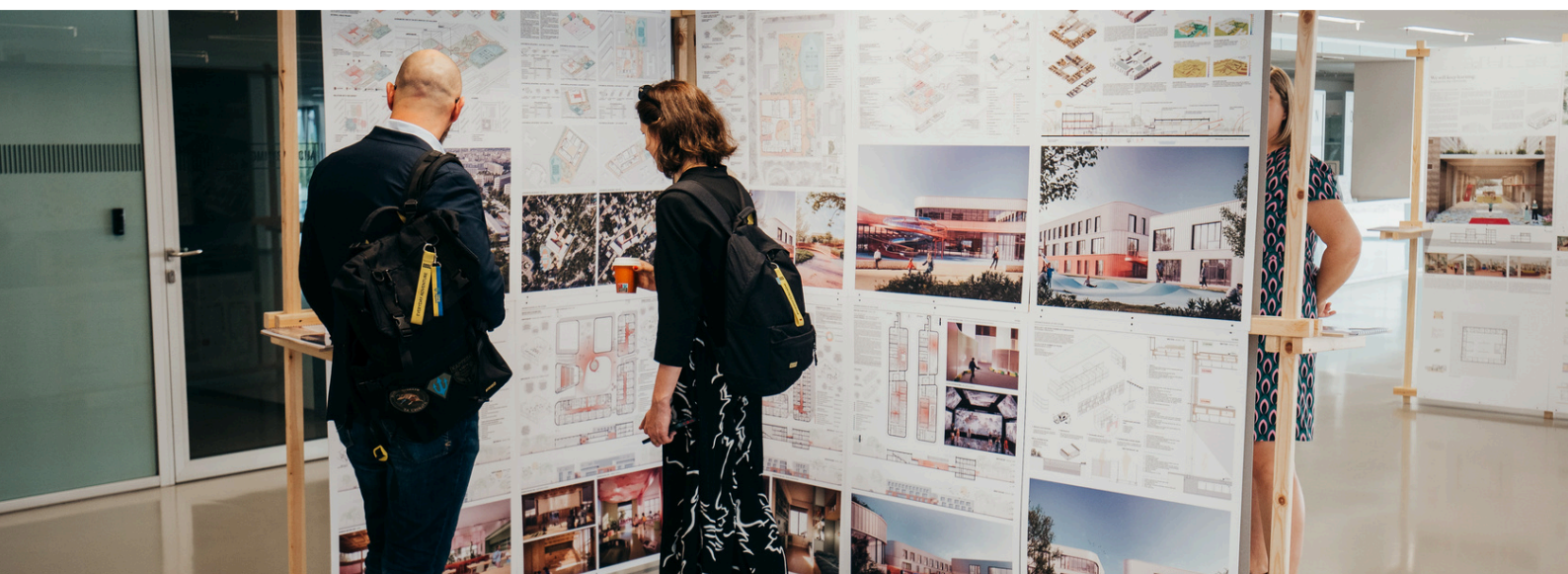
„Ateities mokykla Ukrainoje“ tarptautinio architektūrinio konkurso projektų pristatymas, Vilnius